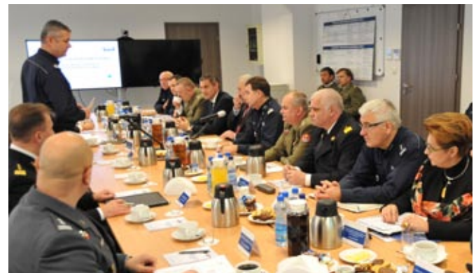
Odprawa MSW z szefami podległych służb zaangażowanych w zabezpieczenie operacji „Klimat”