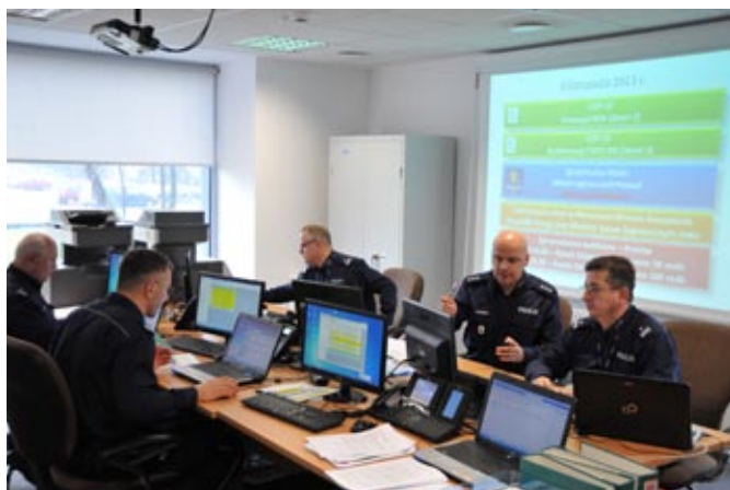
PCD w czasie operacji „Klimat” – funkcjonariusze na służbie