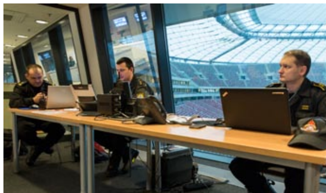
Stadion Narodowy – funkcjonariusze PSP w czasie służby na stanowisku dowodzenia ONZ

Policjanci uczestniczyli również w doskonaleniu zawodowym poświęconym zagadnieniom etyki zawodowej, ochronie praw człowieka oraz problematyce antydyskryminacyjnej.