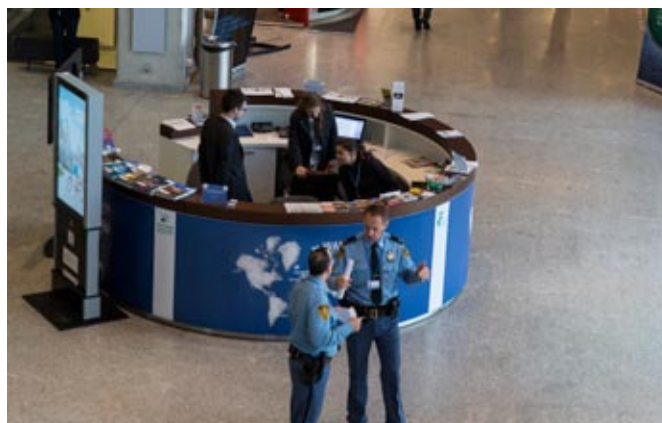
Stadion Narodowy – stoisko promocyjne Polski