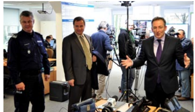
Wizyta Ministra Spraw Wewnętrznych Bartłomieja Sienkiewicza w PCD

Na podstawie decyzji nr 437 Komendanta Głównego Policji z dnia 16 października 2013 r. w sprawie zarządzenia operacji policyjnej oraz upoważnienia do udzielania zgody na użycie lub wykorzystanie środków przymusu bezpośredniego przez pododdziały zwarte, Komendant Główny Policji nadinsp. Marek Działożyński zarządził od dnia 2 listopada do 24 listopada 2013 r. operację policyjną pod kryptonimem „Klimat”.