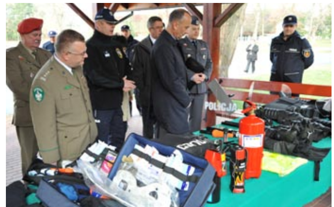
Prezentacja sprzętu specjalistycznego Policji