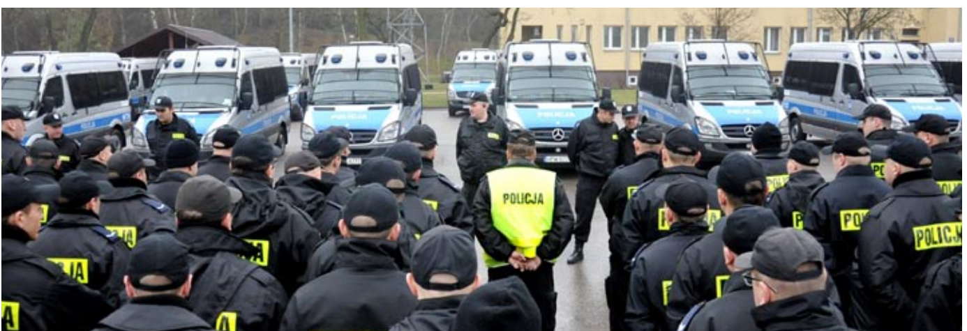
Policjanci ze związków taktycznych – odprawa przed służbą