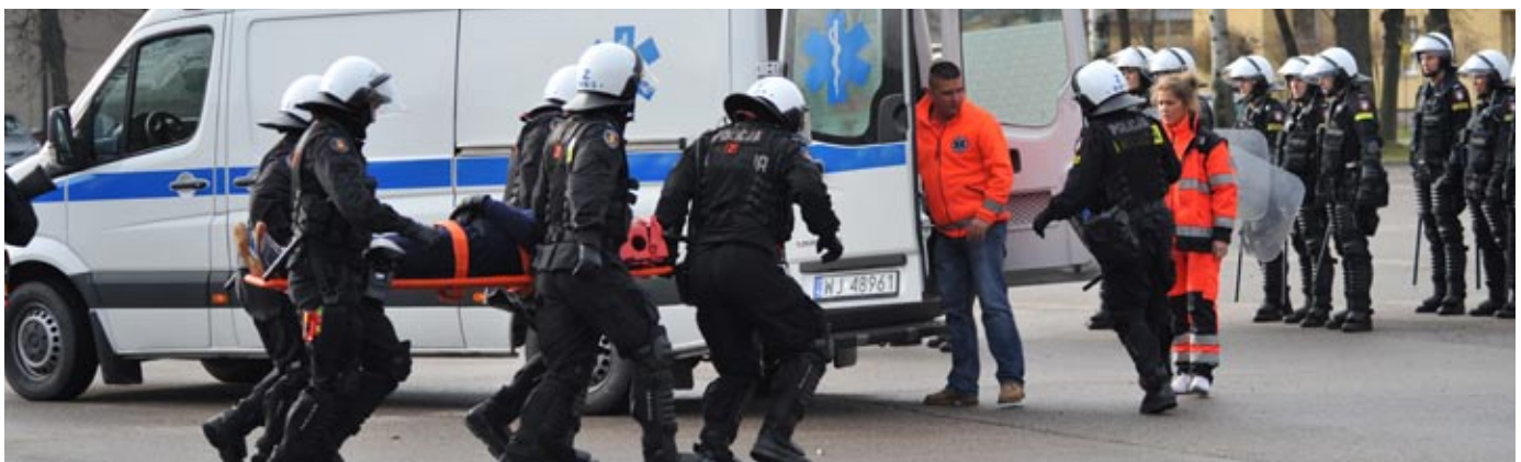
Pokaz działań oddziałów prewencji Policji