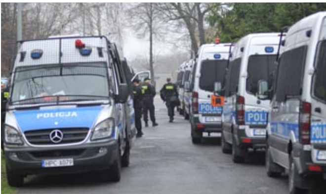
Policjanci ze związków taktycznych – przyjazd do CSP

W zabezpieczenie operacji „Klimat” zaangażowanych było 4500 policjantów Komendy Stołecznej Policji, dodatkowo wspieranych przez 2900 funkcjonariuszy z komend wojewódzkich Policji w Białymstoku, Bydgoszczy, Gdańsku, Katowicach, Kielcach, Krakowie, Lublinie, Łodzi, Olsztynie, Opolu, Poznaniu, Radomiu, Rzeszowie i w Szczecinie. Do współpracy w działaniach prewencyjnych i patrolowych, zgodnie z zarządzeniem Prezesa Rady Ministrów, skierowano 600 żołnierzy Żandarmerii Wojskowej.