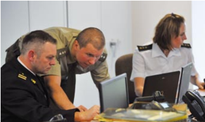
PCD – funkcjonariusze SOK, SG i PSP w czasie operacji „Klimat”