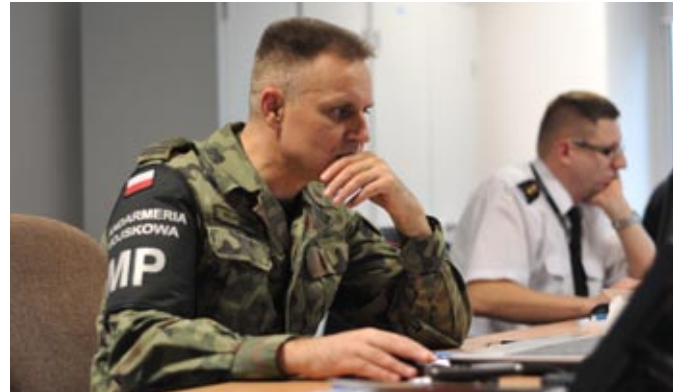
Operacja „Klimat” – żołnierz ŻW w czasie służby w PCD