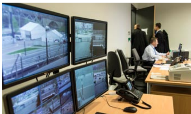
Stadion Narodowy – funkcjonariusz Policji w czasie służby na stanowisku dowodzenia ONZ