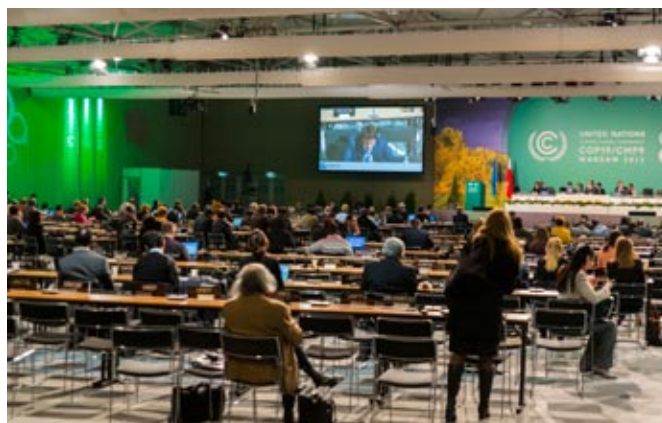
Stadion Narodowy – jedna z sal plenarnych