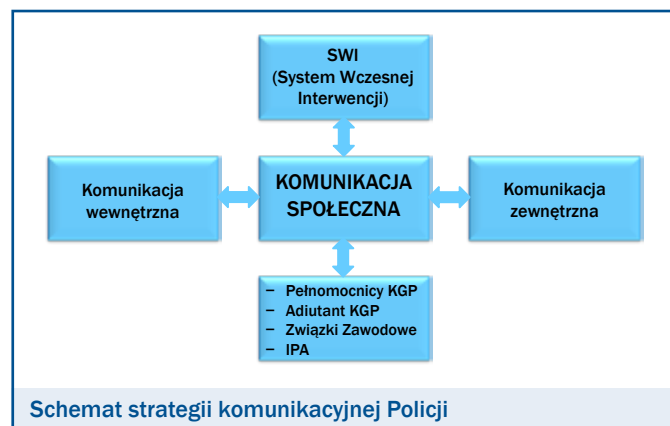
Schemat strategii komunikacyjnej Policji