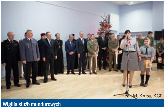
Wigilia służb mundurowych