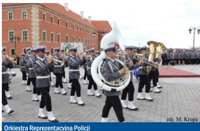
Orkiestra Reprezentacyjna Policji