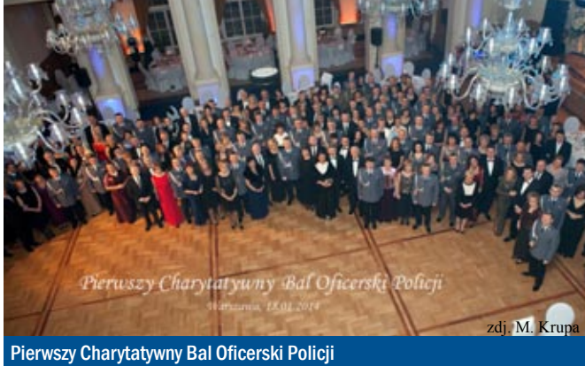
Pierwszy Charytatywny Bal Oficerski Policji

Cały dochód z balu został przekazany na działalność statutową Fundacji Pomocy Wdowom i Sierotom po Poległych Policjantach. Przedsięwzięcie okazało się dużym sukcesem i w znaczący sposób wzmocniło finansowo fundację, a także wpłynęło pozytywnie na proces integracji środowiska policyjnego oraz identyfikacji ze służbą.