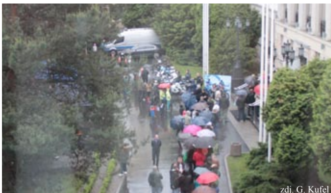
Noc muzeów w KGP

W nocy z soboty na niedzielę 17–18 maja br. Komenda Główna Policji uczestniczyła po raz pierwszy w Międzynarodowej Nocy Muzeów. Z możliwości zwiedzania skorzystało wiele osób, pomimo kilkugodzinnej kolejki. Dla dużej części gości był to pierwszy przystanek tej nocy. Przed budynkiem KGP została zorganizowana wystawa dawnego i współczesnego sprzętu transportowego Policji. Wśród ekspozycji znalazły się m.in. BTR-transporter opancerzony, milicyjna nyska, polonez, UAZ poduszkowiec, potężny mobilny posterunek czy samochód pancerny BOA. Policjanci i funkcjonariusze Biura Operacji Antyterrorystycznych, ubrani w stroje maskujące, z karabinami snajperskimi, byli nieustannie oblegani przez zwiedzających. Migające światła policyjnych radiowozów, blask reflektorów i dźwięki syren nadawały pełen koloryt temu wydarzeniu. Na dziedzińcu Komendy na zwiedzających czekała Orkiestra Reprezentacyjna Policji ze specjalnie przygotowanym repertuarem. Kunszt przedwojennej szermierki na bagnety prezentowała Grupa Rekonstrukcji Historycznej III Okręgu Policji Państwowej Komisariatu w Radomiu. Młodsze dzieci mogły sprawdzić swoje umiejętności jazdy na rowerze w minimiasteczku ruchu drogowego, przygotowanym przez Komendę Stołeczną Policji. Po wejściu do gmachu Komendy na zwiedzających czekał punkt daktyloskopijny oraz możliwość wykonania zdjęcia na przedwojennym krześle do