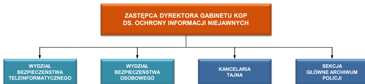
Schemat struktury organizacyjnej pionu ochrony informacji niejawnych Gabinetu KGP