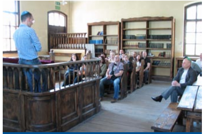
Warsztaty w Centrum Żydowskim w Oświęcimiu – Zrozumieć zło , 2013 r.

damianie i uwrażliwianie policjantów i pracowników Policji na kwestie poszanowania godności człowieka, maksymalizowanie empatycznych postaw policjantów w stosunku do wszystkich osób przebywających w Polsce oraz dbanie o właściwe przygotowanie policjantów do reagowania w przypadku zaistnienia incydentów o charakterze nienawistnym i przestępstw motywowanych nienawiścią wobec innych ludzi.