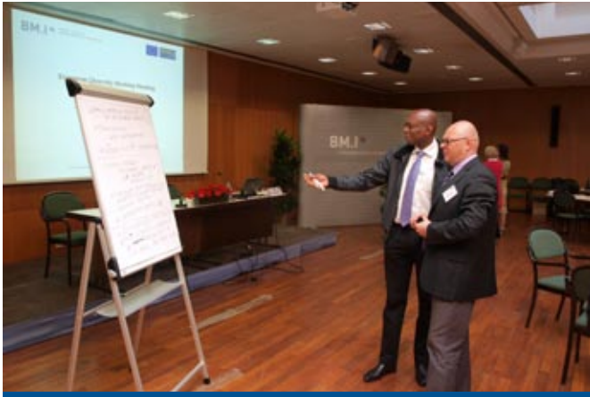
Wiedźń. Międzynarodowy projekt pt. Zarządzanie różnorodnością w Policji , 2012 r.