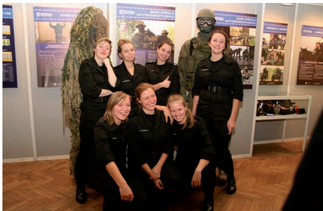
■ Klasa policyjna.