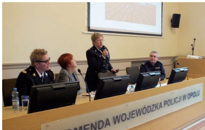
■ Projekt w Opolu

Na mapie Europy, w obszarze handlu ludźmi Polska pełni rolę pomostu łączącego ją z krajami Europy Zachodniej. W 2014 r. na terenie naszego kraju, tj. na terenie działania KPP w Raciborzu i KMP w Opolu, wspólnie z policją holenderską z komend w Hadze i Apeldoorn były realizowane dwa projekty. Ich głównym założeniem było przekazanie przez policjantów holenderskich studentom oraz osobom poszukującym pracy na terenie Holandii informacji o zagrożeniach związanych z podjęciem nielegalnej lub legalnej pracy. Ponadto zostały przedstawione okoliczności, w jakich najczęściej obcokrajowcy stają się ofiarą handlu ludźmi, przymusowej pracy lub oszustwa. Dodatkowo uczestnikom spotkań przekazano praktyczne informacje o tym, gdzie i do kogo zwrócić się o pomoc w takich przypadkach. Realizacja projektów była możliwa dzięki wspomnianemu już partnerstwu Policji z władzami samorządowymi, miejskimi urzędami pracy oraz wyższymi uczelniami.