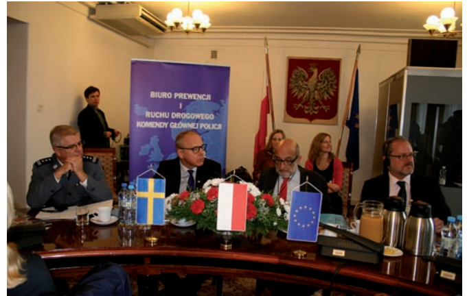
■ Seminarium polsko-szwedzkie.