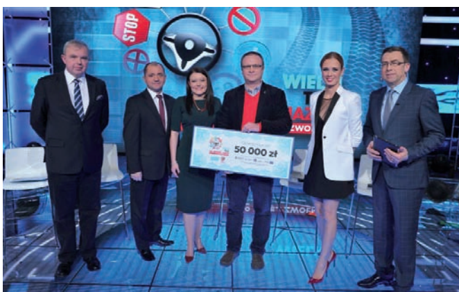
■ Wielki test na prawo jazdy.