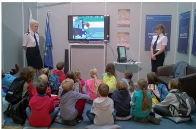
■ Grupa z ekspertami.