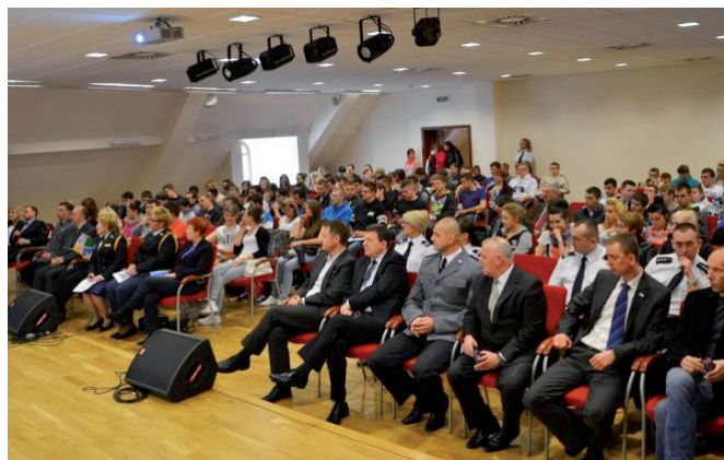
■ Projekt w Raciborzu.

„Partnerstwo międzynarodowe w projektowaniu działań z zakresu prewencji kryminalnej jest koniecznym kierunkiem. Przykładem są projekty prewencyjne realizowane z policją holenderską, nakierowane na edukację głównie młodych polskich obywateli zamierzających wyjechać z kraju za granicę w poszukiwaniu pracy”.