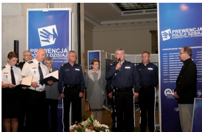
■ Otwarcie projektu.