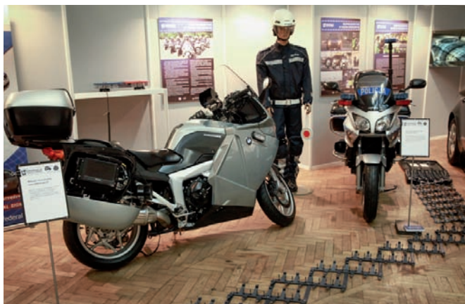
■ Kluczowe działy wystawy.

Każdego dnia projektu do dyspozycji uczestników byli eksperci Komendy Głównej Policji, komend wojewódzkich Policji, Komendy Stołecznej Policji oraz Centrum Szkolenia Policji w Legionowie, niezależni eksperci reprezentujący instytucje pozapolicyjne, którzy odpowiadali na pytania dzieci, młodzieży, opiekunów, ale także zapraszali do rozmowy o prewencji Policji indywidualnych gości, wśród których znalazł się m.in. Przewodniczący Rady Europejskiej Donald Tusk z rodziną.