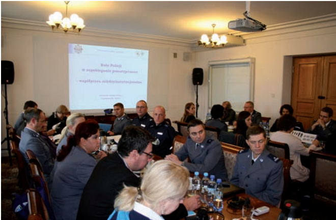
■ Seminarium polsko-szwedzkie.