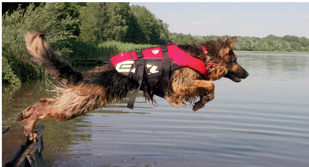
Trening ratownictwa wodnego.

na opisać, iż tam, gdzie kończy się praca psa tropiącego, tam rozpoczyna się praca psa ratowniczego. Pies tropiący pracuje w pierwszych godzinach od zaginięcia, kiedy ślad zapachowy jest najintensywniejszy. Pies ten ma możliwość wybierania „wiatru”, aby zwiększyć swoją skuteczność, a pies śledzący może poruszać się tylko dolnym wiatrem. Kiedy pies tropiący, nadając kierunek poszukiwań, kończy swoją pracę, zaczyna ją pies ratowniczy. Pies ratowniczy przeszukuje sektory, odbiegając od przewodnika na duże odległości i ściągając zapach nawet z 500–800 m. Dla psa ratowniczego czas rozkładania się zapachu nie odgrywa roli, szuka żywej osoby, molekuł zapachowych unoszących się w powietrzu i będących informacją o jego źródle. Jeśli osoba żyje, pies ratowniczy wskaże ją bez względu na upływający czas.