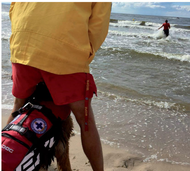
Praca z pozorantem w ratownictwie wodnym.