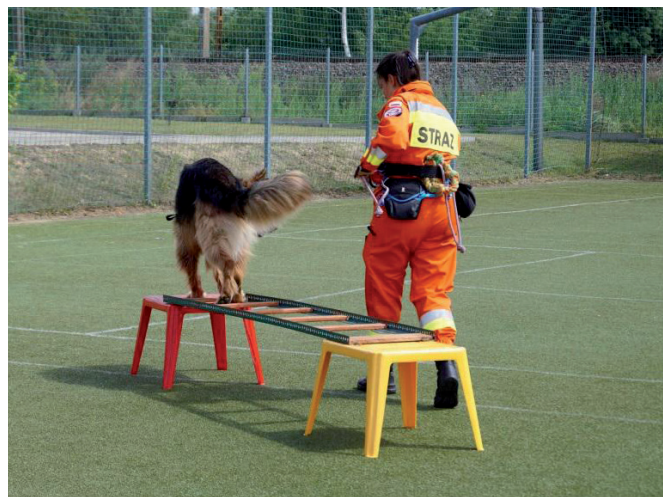
Trening sprawnościowy.

Pies uczony jest również innych zachowań, które – gdy zwierzę osiąga wiek około 1–1,5 roku – łączy się w całość, co skutkuje uzyskaniem określonych, czytelnych zachowań psa w przypadku odnalezienia człowieka (szczekanie, sposób oznaczania, ćwiczenia z pozorantami) 11 . Szkoląc psa do pracy ratowniczej, można dodać element zachowania łowieckiego – poszukiwanie zdobyczy-nagrody, czyli cały ciąg tych zachowań: pies poszukuje zaginionego, następnie otrzymuje gryzak, jako zdobycz do złapania, czyli zagryzienia, a na końcu smakołyk od przewodnika, co symuluje wspólne spożywanie upolowanej zdobyczy. Wykorzystując wszystkie zachowania łowieckie, motywuje się psa najsilniej, zaspokajając wszystkie jego naturalne popędy związane z polowaniem. Używając tej