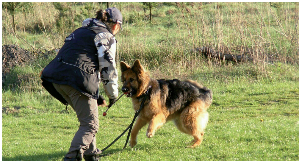
Trening motywacyjny.

wiskowej specjalności ratowniczej, zwanego dalej „egzaminem gruzowiskowym”, klasy 0 albo egzaminu terenowej specjalności ratowniczej, zwanego dalej „egzaminem terenowym”, klasy 0 i uzyskanie gruzowiskowej specjalności ratowniczej klasy 0 albo terenowej specjalności ratowniczej klasy 0. W tym okresie psa należy wyszkolić w zakresie posłuszeństwa użytkowego i współpracy oraz lokalizacji osób i ich oznaczania. Trzeci etap szkolenia obejmuje okres od uzyskania przez zespół gruzowiskowej specjalności ratowniczej klasy 0 albo terenowej specjalności ratowniczej klasy 0 do zdania przez zespół