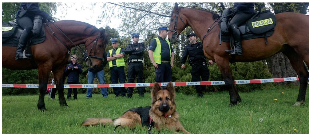
Trening koncentracji uwagi psa.

W zakresie współdziałania Policji z grupami poszukiwawczo-ratowniczymi należy wskazać, że w wyniku nawiązanej współpracy Komendy Głównej Policji z Państwową Strażą Pożarną w zakresie poszukiwań osób zaginionych prowadzonych w terenie podpisano porozumienie między Komendantem Głównym Państwowej Straży Pożarnej a Komendantem Głównym Policji z dnia 12 czerwca 2001 r. o współdziałaniu Państwowej Straży Pożarnej i Policji. W celu wprowadzenia w życie założeń porozumienia opracowano „Procedury i algorytmy dysponowania Specjalistycznych Grup Poszukiwawczo-Ratowniczych Krajowego Systemu Ratowniczo-Gaśniczego