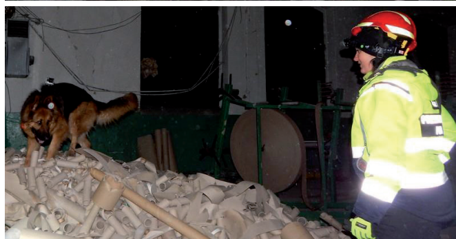
Ćwiczenia gruzowiskowe.