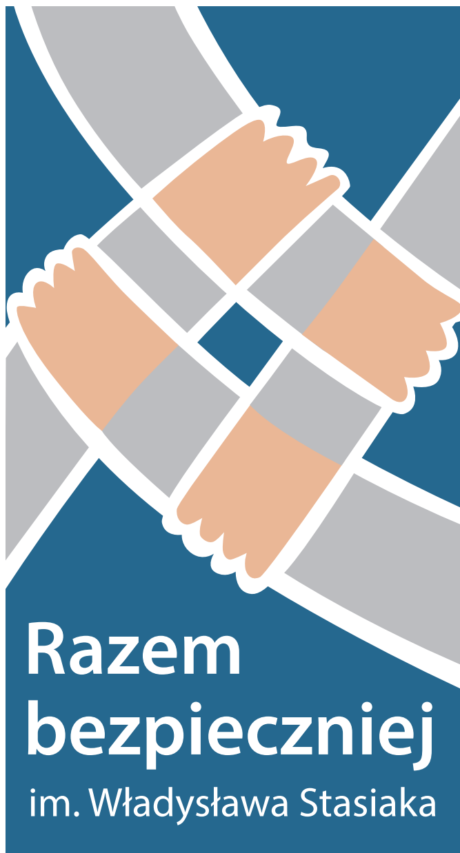
Rys. 1. Logo programu „Razem bezpieczniej” im. Władysława Stasiaka

Działania są prowadzone na terenie całego kraju. Realizacja projektów jest poprzedzona diagnozą, oceną możliwości ich wdrożenia przez wnioskodawców oraz określeniem zakresu zadań wpisujących się w obszary Programu. Projekty złożone w ramach naboru wniosków są weryfikowane przez właściwe instytucje odpowiedzialne za ocenę i wybór projektów. Projekty wybierane przez komisje eksperckie na dwóch poziomach – wojewódzkim i ostatecznie – centralnym, rekomendowane przez zespół koordynujący Program oraz zatwierdzone przez Ministra Spraw Wewnętrznych i Administracji, są najlepszymi, najbardziej innowacyjnymi i efektywnymi przedsięwzięciami profilaktycznymi, które, realizowane na poziomie lokalnym, wpływają na wzrost świadomości zagrożeń oraz propagują wzorce bezpiecznych zachowań w całej Polsce. Poza projektami lokalnymi rządowy Program wspiera również inicjatywy ogólnopolskie organizowane przez różne podmioty. Warto wspomnieć o Mistrzostwach Świata Dzieci z Domów Dziecka w Piłce Nożnej organizowanych od 2012 r.