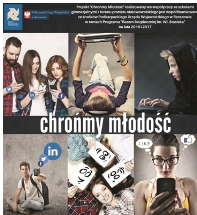
Rys. 2. Plakat projektu „Chrońmy młodzież”

Działania są prowadzone na terenie całego kraju. Realizacja projektów jest poprzedzona diagnozą, oceną możliwości ich wdrożenia przez wnioskodawców oraz określeniem zakresu zadań wpisujących się w obszary Programu. Projekty złożone w ramach naboru wniosków są weryfikowane przez właściwe instytucje odpowiedzialne za ocenę i wybór projektów. Projekty wybierane przez komisje eksperckie na dwóch poziomach – wojewódzkim i ostatecznie – centralnym, rekomendowane przez zespół koordynujący Program oraz zatwierdzone przez Ministra Spraw Wewnętrznych i Administracji, są najlepszymi, najbardziej innowacyjnymi i efektywnymi przedsięwzięciami profilaktycznymi, które, realizowane na poziomie lokalnym, wpływają na wzrost świadomości zagrożeń oraz propagują wzorce bezpiecznych zachowań w całej Polsce. Poza projektami lokalnymi rządowy Program wspiera również inicjatywy ogólnopolskie organizowane przez różne podmioty. Warto wspomnieć o Mistrzostwach Świata Dzieci z Domów Dziecka w Piłce Nożnej organizowanych od 2012 r.