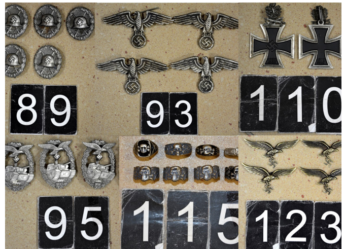
Fot. 3. Odznaczenia faszystowskie.

ty w związku z art. 109 ustawy o zabytkach i opiece nad zabytkami (w zakresie dotyczącym nielegalnego wywozu przedmiotów archeologicznych) i wniesiono akt oskarżenia wobec niej (fot. 3). W listopadzie 2017 r. funkcjonariusze Podlaskiego Oddziału SG wszczęli postępowanie przygotowawcze w związku z próbą wywozu bez pozwolenia poza granice UE, tj. o czyn z art. 270 § 1 Kodeksu karnego (posłużenie się przerobionym dokumentem) w zw. z art. 109 ust. 1 ustawy o zabytkach i opiece nad zabytkami (nielegalny wywóz zabytku), zabytkowego pojazdu marki Rolls-Royce z 1937 r. o wartości ponad 59 000 euro. Sprawca posługiwał się jednocześnie przerobionym dokumentem w postaci listu przewozowego CMR. Poddał się dobrowolnie karze (fot. 1).