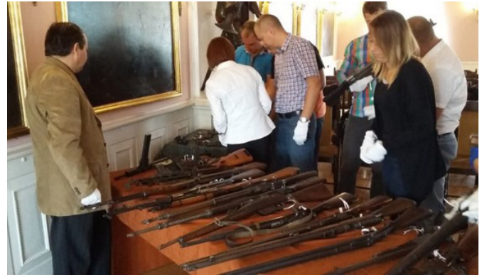
Fot. 2. Szkolenie Straży Granicznej.

W listopadzie 2016 r. funkcjonariusze Śląskiego Oddziału SG dokonali ujawnienia ponad 7500 monet różnych państw, białej broni, elementów archeologicznych pochodzących z okresu II i III wieku naszej ery oraz dużej liczby emblematów i odznaczeń faszystowskich. Zatrzymano jedną osobę, której postawiono zarzu-