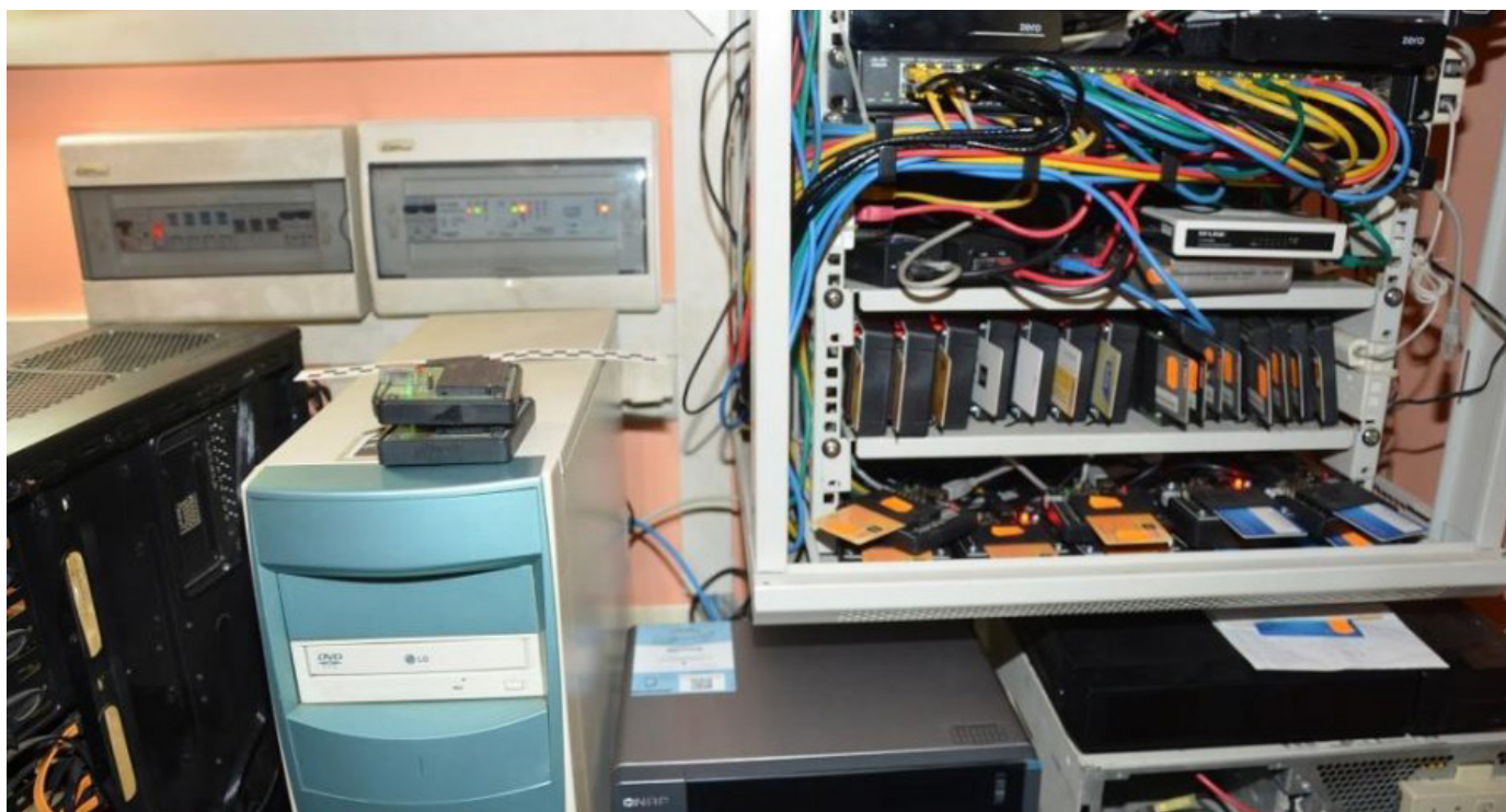
Serwer dawcy sharingu z zainstalowanymi kartami abonenckimi.

w celu ustalenia sprawcy lub sprawców tego czynu, zgodnie z przepisami Kodeksu postępowania karnego 5 . Należy pamiętać, że powyższe przestępstwo jest ścigane na wniosek i niezbędne jest przyjęcie takiego wniosku w celu prowadzenia postępowania przygotowawczego. Wniosek składa dostawca sygnału telewizyjnego, usług internetowych lub inny operator będący pokrzywdzonym, zazwyczaj reprezentowany przez pracownika lub pełnomocnika. Taki wniosek może złożyć również Stowarzyszenie „Sygnał” jako krajowa organizacja działająca w ochronie interesów przedsiębiorców świadczących usługi polegające na dostępie warunkowym.