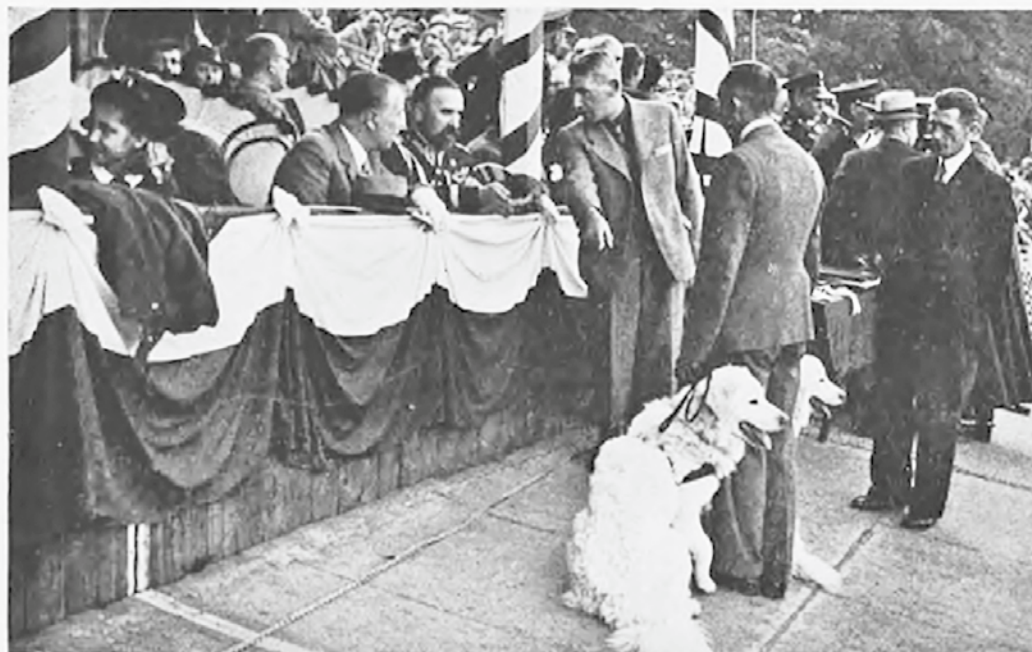
Fragment popisów tresury psów policyjnych w Łodzi: Gen. Kordian-Zamorski ogląda owczarki podhalańskie ofiarowane Policji Państwowej przez Pol. Związek Hodowców Psów Rasowych.