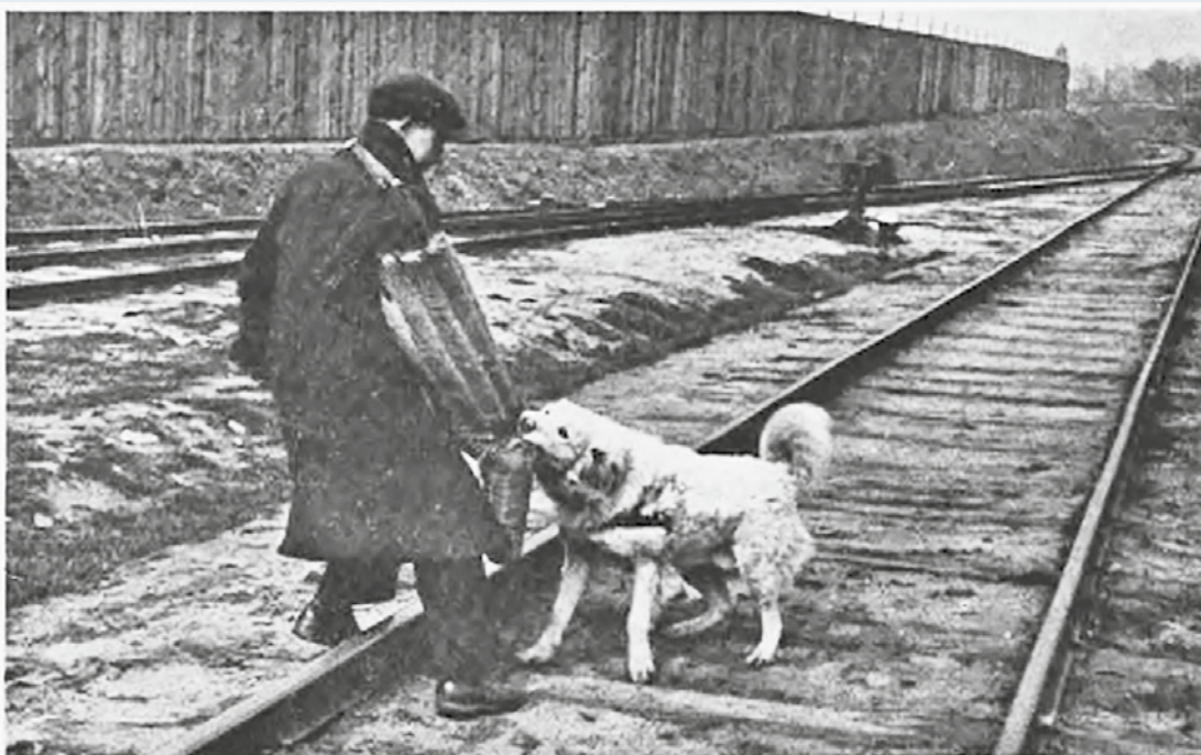
Pies służbowy „Ornak” przytrzymał ściganego.