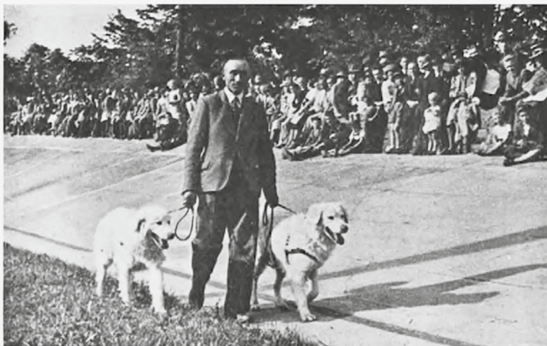
Fragment z popisów tresury psów policyjnych w Łodzi. Owczarki podhalańskie przekazane Pol. Państw. przez Polski Związek Hod. Psów Ras.