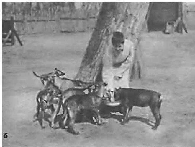
6. Pierwsza młódź H. i T.