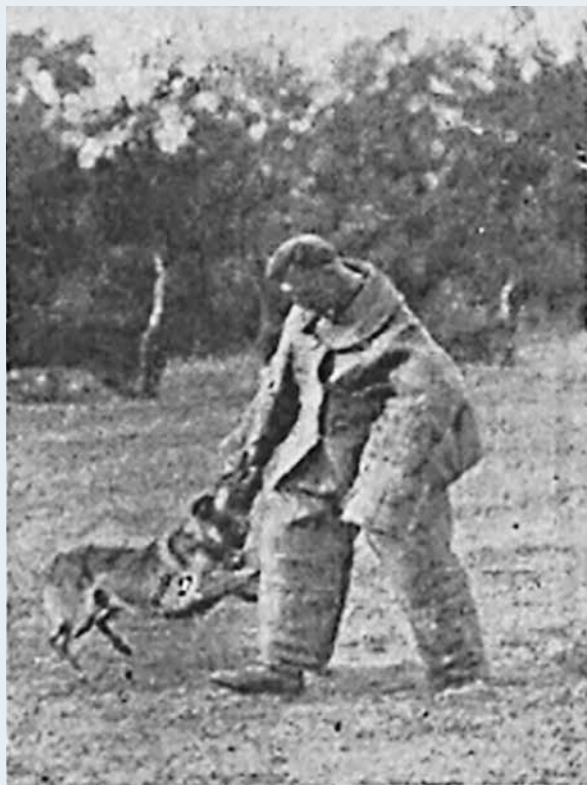
Fot. 2. Tresura psa policyjnego.

Autor opisał tu bardzo szczegółowo koncepcję działań hodowlanych z wykorzystaniem zwierząt służbowych. Oprócz tego przedstawił szereg druków urzędowych przygotowanych specjalnie po to, aby zapewnić rozliczalność i dokładną ewidencję prowadzonych miotów. Skąpe informacje archiwalne wskazują, że próby działań hodow-