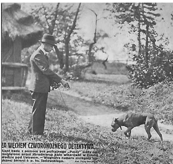
ZA WECEM CZWORONOZNEGO DETEKTYWA... Nient bada z pomocą psa policyjnego „Pasy” ślady po- zostawione przez zbrodniarza koło wikarówki w Zimnej Wodzie pod Lwowem. — Wewnątrz numeru strzegóły tra- jiczej śmierci s. p. ks. Sadowskiego.

Na koniec autor podręcznika zalecał prowadzenie szczegółowej ewidencji psów policyjnych w tzw. głównej księdze ewidencyjnej psów policyjnych prowadzonej w Wydziale IV KG PP 30 .