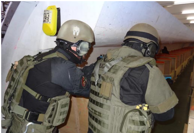
Szkolenie w GSG-9 na pokładzie samolotów pasażerskich