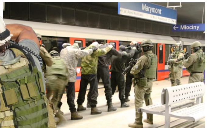
Szkolenie w metrze warszawskim

przestępców. Funkcjonariusze poszczególnych komórek organizacyjnych BOA KGP uczestniczyli w szkoleniach poligonowych w kraju i za granicą zarówno w ramach własnego programu szkoleniowego, jak i wspólnie z innymi służbami i instytucjami.