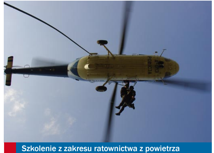
Szkolenie z zakresu ratownictwa z powietrza

Jednostka odbyła również szkolenia z zagranicznymi podmiotami nieuczestniczącymi w grupie zadaniowej Atlas. Przykładem może być zgrupowanie w północno-wschodniej części Włoch w Dolomitach. Jego organizatorem był ośrodek szkoleniowy włoskiej policji. Szkolenie dotyczyło zagadnień związanych z wykorzystaniem materiałów wybuchowych do pokonywania przeszkód budowlanych. Wzięli w nim udział funkcjonariusze SPAP i SAT KWP. Szkolenie z zakresu pirotechniki zostało również zrealizowane w ramach zgrupowania na Słowacji.