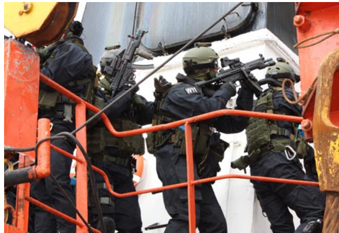
Szkolenia na jednostkach pływających

Kijowskiego. Uczestniczący w nim funkcjonariusze korzystali z bazy ośrodka. Szkolenia odbywały się na specjalistycznych urządzeniach, wykorzystywanych na co dzień w treningach kadry olimpijskiej. Istotnym elementem zgrupowania były również zajęcia z psychologiem sportowym przygotowującym kadrę do udziału w najważniejszych zawodach sportowych.