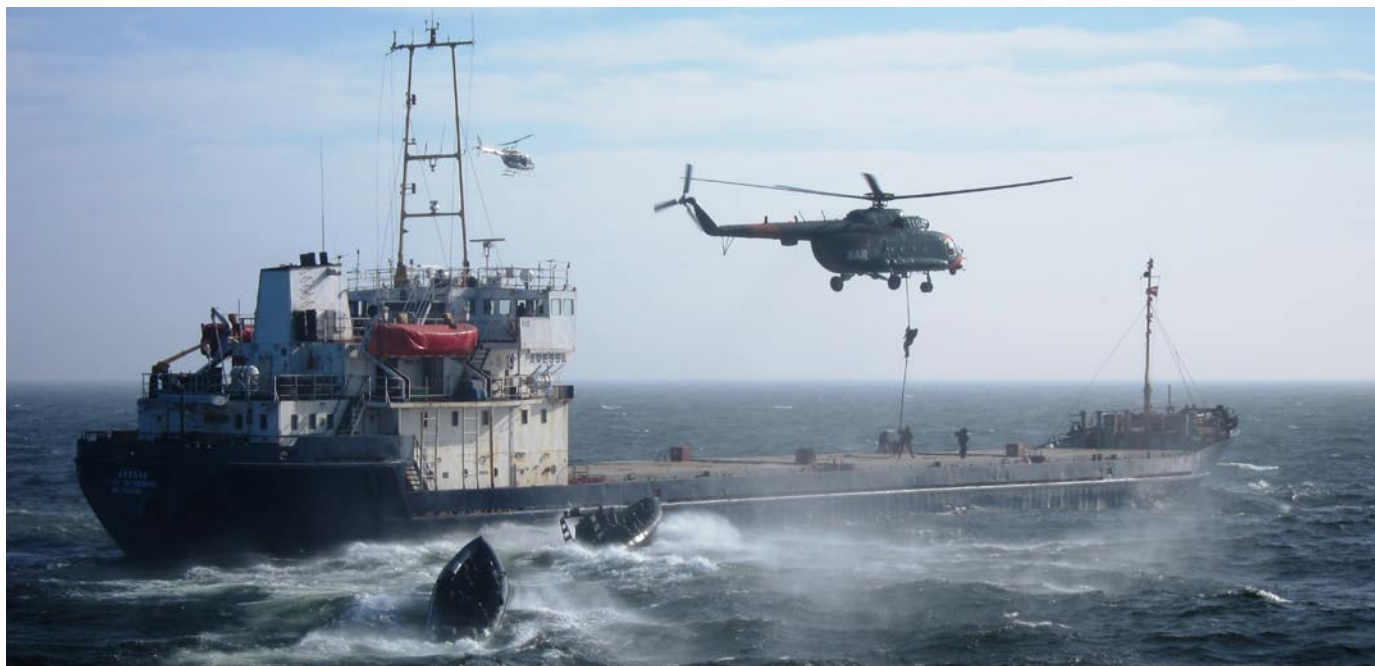
Ćwiczenie jednostek Atlas na Łotwie