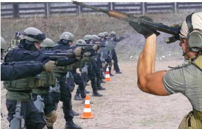
Szkolenie strzeleckie w SP w Pile

przedsięwzięć taktycznych wspólnie z wojskowymi jednostkami wchodzącymi w skład Dowództwa Wojsk Specjalnych, zwłaszcza z Jednostką Wojskową GROM oraz Jednostką Wojskową FORMOZA. Szkolenia obejmowały zagadnienia dotyczące taktyki antyterrorystycznej oraz działań związanych z sytuacjami zakładniczymi i zabarykadowaniami. Były prowadzone przy wykorzystaniu śmigłowców, pojazdów, łodzi i pontonów bojowych. Uczestniczyli w nich strzelcy wyborowi z jednostek, mający za zadanie wypracowanie wspólnych procedur reagowania w przypadku operacji połączonych. Bardzo istotnym elementem w procesie szkoleniowym funkcjonariuszy BOA KGP jest doksztalcanie w różnego rodzaju centrach szkoleniowych, mające formę wykładów akademickich lub przeprowadzane z ekspertami w dziedzinach, które nie są stricte związane z zagadnieniami taktycznymi, lecz mają ogromny wpływ na wyszkolenie całej jednostki. Przykładem tego typu szkoleń są m.in. warsztaty poświęcone balistyce w strzelectwie długodystansowym, na których głównym prelegentem był ekspert z zakresu balistyki prof. Jerzy Ejsmont. Organizatorem tych warsztatów było BOA KGP, które zaprosiło do uczestnictwa funkcyjariu-