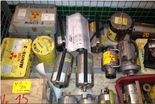
Pojemnik na materiały radioaktywne