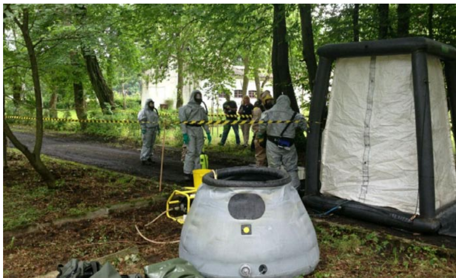
Zestaw do dekontaminacji operatorów

W trakcie realizowanych działań funkcjonariusze muszą posiadać indywidualne środki ochrony górnych dróg oddechowych oraz powierzchni ciała. Należy mieć świadomość, iż sprzęt oraz ubiór ochronny powinny zapewniać maksymalną