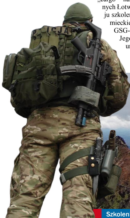
Szkolenie z TOPR w Zakopanem

Kolejnym istotnym szkoleniem były warsztaty z zakresu wykorzystywania technik wysokościowych w działaniach bojowych, zorganizowane przez litewski ARAS, jednostkę zrzeszoną w grupie Atlas. Zajęcia odbywały się w zespole budynków znajdujących się w ośrodku poligonowym w Kłajpedzie. Policjanci wymienili doświadczenia z zakresu bojowego zakładania stanowisk, technik zjazdów oraz stosowania specjalistycznego wyposażenia dedykowanego do tego typu realizacji. Ważnym przedsięwzięciem było także uczestnictwo w szkoleniu corocznie przeprowadzanym ze słowacką jednostką LYNX. Wzięli w nim udział policjanci Sekcji Strzelców Wyborowych. Warsztaty polegały na wymianie doświadczeń oraz na zajęciach praktycznych – poligonowych – dotyczących wykorzystania strzelców wyborowych stanowiącego element wczesnego rozpoznania obiektu, zabezpieczenia działań grup szturmowych oraz neutralizacji zagrożenia.