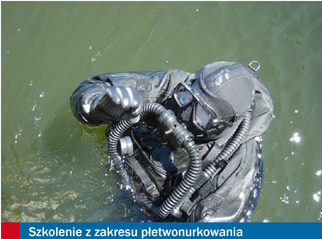
Szkolenie z zakresu pletwonurkowania