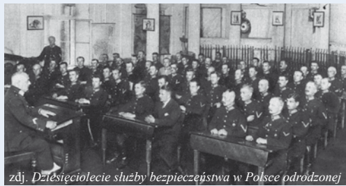
zdj. Dziesięciolecie służby bezpieczeństwa w Polsce odróżnionej

1937 r. – Centralna Registratura Daktyloskopijna działająca w strukturze Centrali Służby Śledczej zgromadziła 635 tysięcy kart daktyloskopijnych.