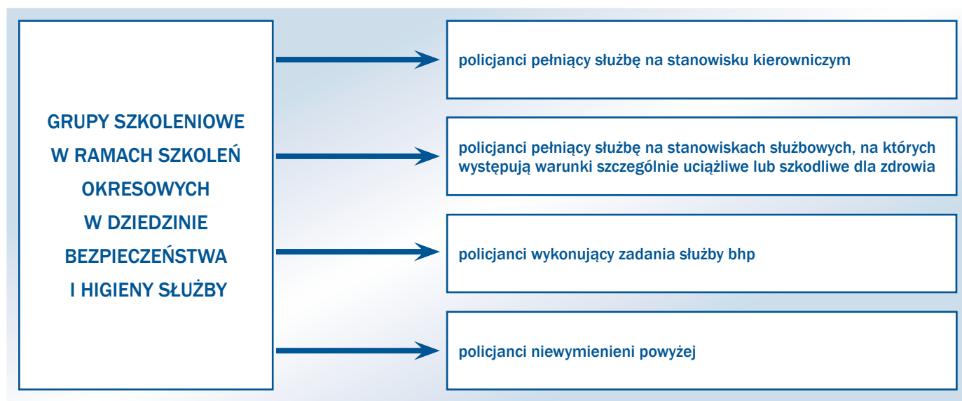
Rysunek 3. Rodzaje grup szkoleniowych w ramach szkoleń okresowych w dziedzinie bezpieczeństwa i higieny służby w Policji.