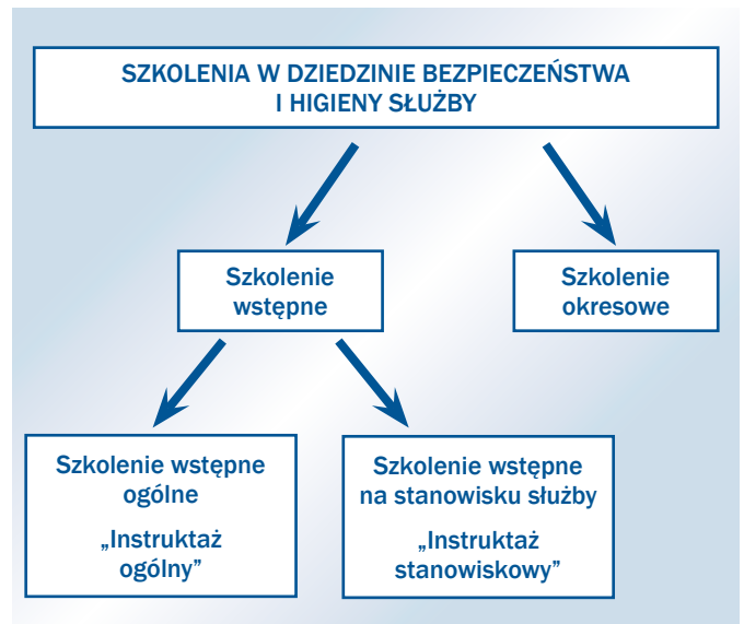
Rysunek 1. Podział szkoleń w dziedzinie bezpieczeństwa i higieny służby w Policji.

Od 2 grudnia 2016 r. szkolenia policjantów w dziedzinie bezpieczeństwa i higieny służby zostały uregulowane w art. 71c ustawy o Policji, a ich podział przedstawia rysunek 1.