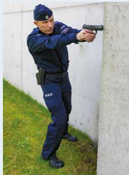
Fot. 3. Postawa strzelecka stojąca podczas strzelania zza osłony wysokiej.