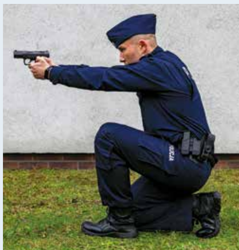
Fot. 5. Postawa strzelecka klęcząca niska, widok z boku.