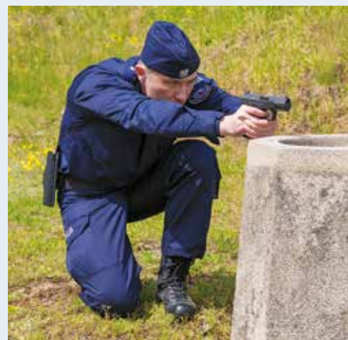
Fot. 6. Postawa klęcząca niska podczas strzelania zza osłony. Zwraca uwagę dobór wysokości postawy do wysokości osłony.