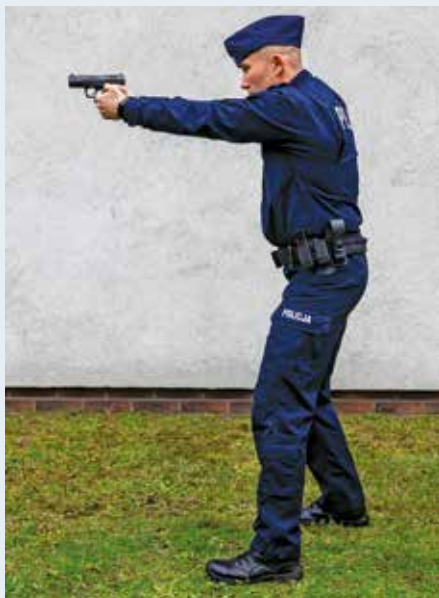
Fot. 2. Postawa strzelecka stojąca, widok z boku.