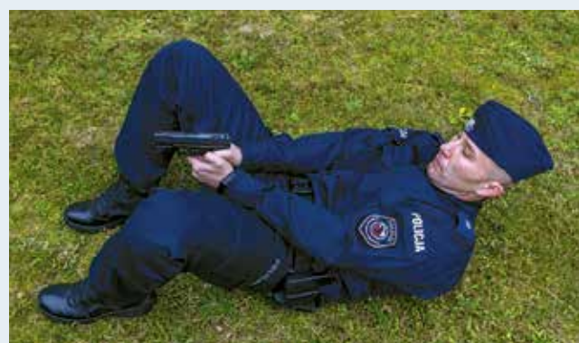
Fot. 12. Postawa leżąca na plecach, widok z boku.