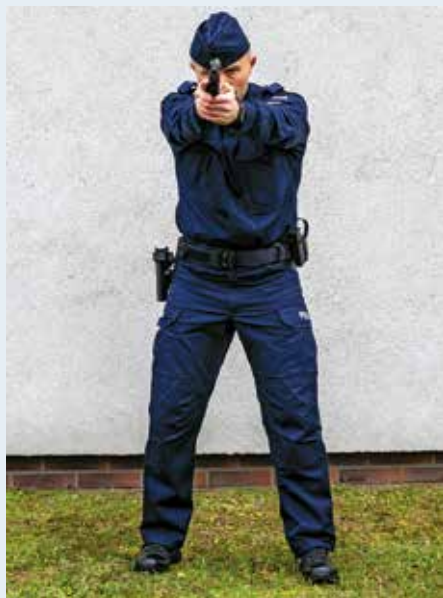
Fot. 1. Postawa strzelecka stojąca, widok z przodu.