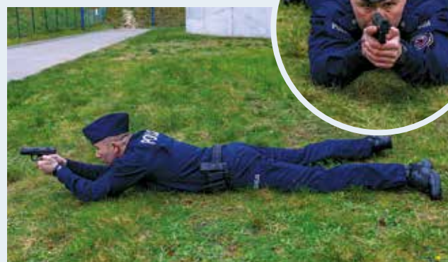
Fot. 16 i 17. Postawa leżąca na brzuchu, widok z przodu i z boku.