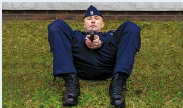
Fot. 11. Postawa leżąca na plecach, widok z przodu.