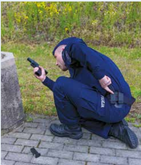
Fot. 7. Awaryjna wymiana magazynka, w postawie kłęczącej niskiej za osłoną.