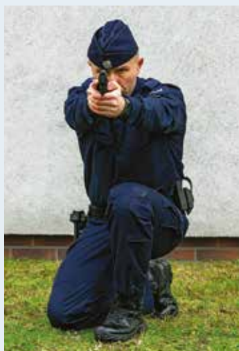
Fot. 4. Postawa strzelecka klęcząca niska, widok z przodu.