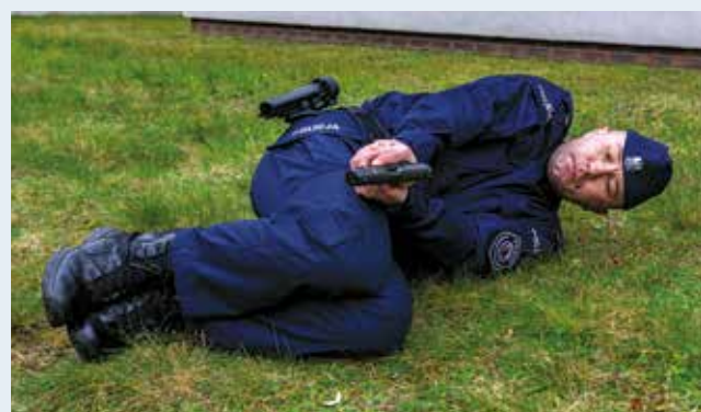
Fot. 14. Postawa leżąca na boku, broń wyprowadzona ponad kolanami.