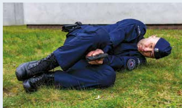
Fot. 13. Postawa leżąca na boku, broń wyprowadzona między kolanami.