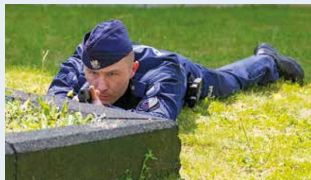
Fot. 18. Wykorzystanie postawy leżącej na brzuchu podczas strzelania zza osłony. Fot. 1-18 – R. Karyś.