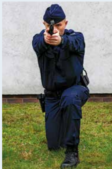
Fot. 8. Postawa strzelecka kłęcząca wysoka, widok z przodu.