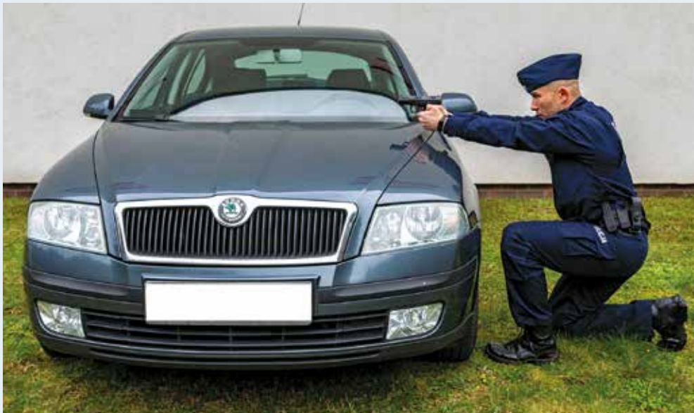
Fot. 10. Postawa kłęcząca wysoka podczas strzelania zza maski samochodu.

W postawie kłęczącej wysokiej lewa noga jest ustawiona w taki sposób, aby podudzie i udo tworzyło kąt ok. 90 stopni. Tułów powinien być pochylony lekko do przodu. Ręce są wyprostowane, zablokowane w łokciach.