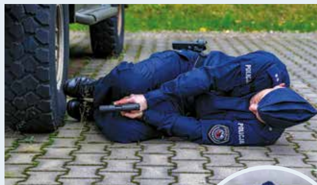
Fot. 15. Strzelanie zza koła pojazdu w postawie leżącej na boku.