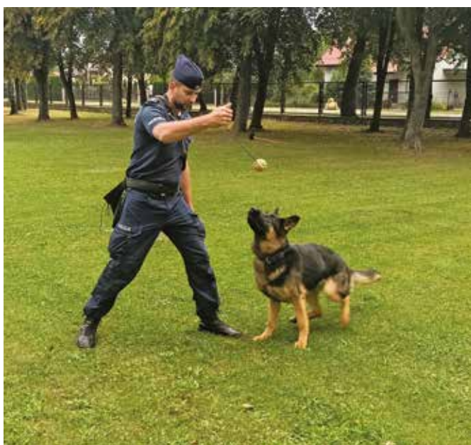
Fot. 4. Kandydat na przewodnika podczas zabawy z psem.

Biorąc pod uwagę koszty wyszkolenia człowieka i psa, niektórzy autorzy podkreślają, że rekrutacja w stosunku do osób deklarujących chęć pracy z psem powinna być bardzo drobiazgową 37 . Podkreślają także, że „komendanci wojewódzcy mogą w drodze decyzji określać dodatkowe zasady doboru policjantów typowanych na przewodników psów służbowych” 38 . Taka praktyka od lat prowadzona jest w garnizonie śląskim. Skierowanie na kurs specjalistyczny do ZKP CSP poprzedzone jest przejściem określonej procedury typowania i naboru 39 . Poza ogólnymi – omawianymi na wstępie wymaganiami – dodatkowym wymogiem jest odbycie praktyki, która ma zapoznać osobę rekrutowaną z obowiązkami przewodnika psa, taktyką i techniką użycia psów służbowych, przepisami prawnymi, prowadzoną dokumentacją, zasadami utrzymania sprawności użytkowej psów. Odbycie praktyki potwierdzone jest w Dzienniku praktyk oraz wystawieniem opinii przez opiekuna praktyki i kończy się sprawdzianem oraz rozmową kwalifikacyjną 40 .