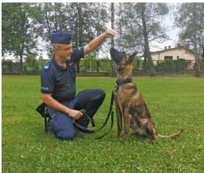
Fot. 1. Kandydat na przewodnika z przydzielonym mu psem służbowym.

Kolejne dni kursu to proces stopniowego osvajania zwierzęcia, nauki odczytywania jego reakcji w różnych sytuacjach. W zasadzie wszystko, co się dzieje na kursie, musi być zainicjowane i przeprowadzone przez człowieka – przyszłego przewodnika i przydzielonego mu czworonoga. Instruktor tresury nie może wytresować psa za niego. Najważniejsze jest, by tresura zwierzęcia była przeprowadzana przez osobę, która docelowo będzie wykonywała obowiązki służbowe z psem 13 . Tylko w ten sposób osoba prowadząca psa będzie mogła odczytywać jego reakcje i prawidłowo interpretować jego zachowania 14 . Takie rozwiązanie daje szansę na skuteczne wykorzystanie potencjału zwierzęcia w czasie realnych działań wykrywczych – tropienia, przeszukania i innych czynności. Program szkolenia nie przewiduje zbyt wiele czasu na zajęcia teoretyczne 15 . Większość zajęć to tresura praktyczna, która odbywa się z reguły na powietrzu, w zmiennych