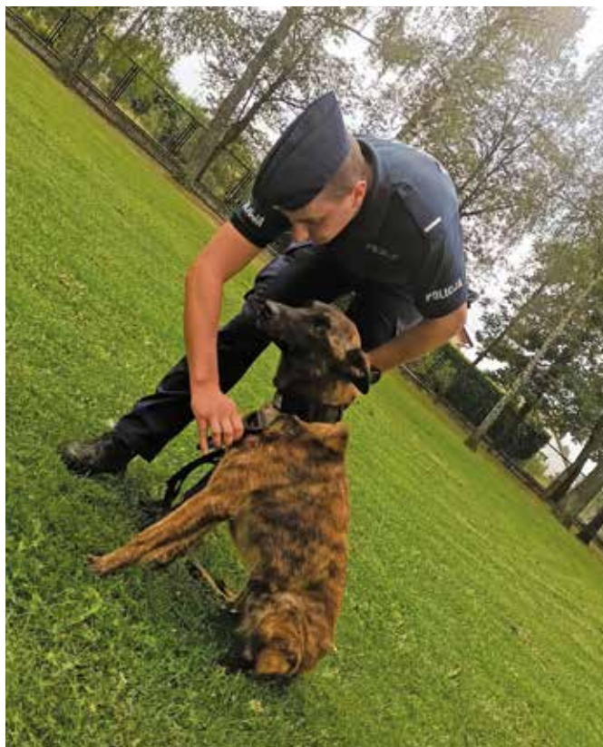
Fot. 3. Codzienne zabiegi pielęgnacyjne.

Są to obowiązki realizowane w normalnym czasie służby, ale często także poza nim. Można je również określić jako nietypowe i wykraczające poza obowiązki służbowe większości policjantów. Niektóre czworonogi po spełnieniu określonych procedur zamieszkają ze swoimi opiekunami w domu i staną się pełnoprawnymi członkami rodzin. Większość jednak pozostanie w obiektach służbowych Policji, gdzie także będzie wymagała dalszej opieki i troski przewodnika.