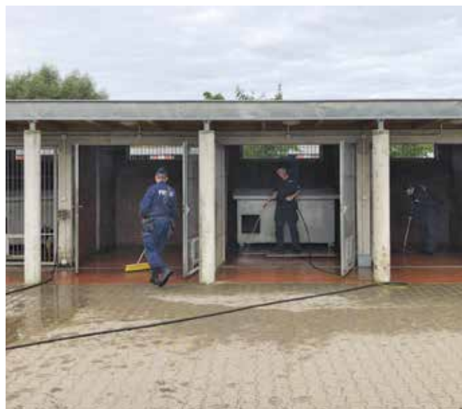
Fot. 2. Czynności związane z utrzymaniem dobrostanu zwierząt.