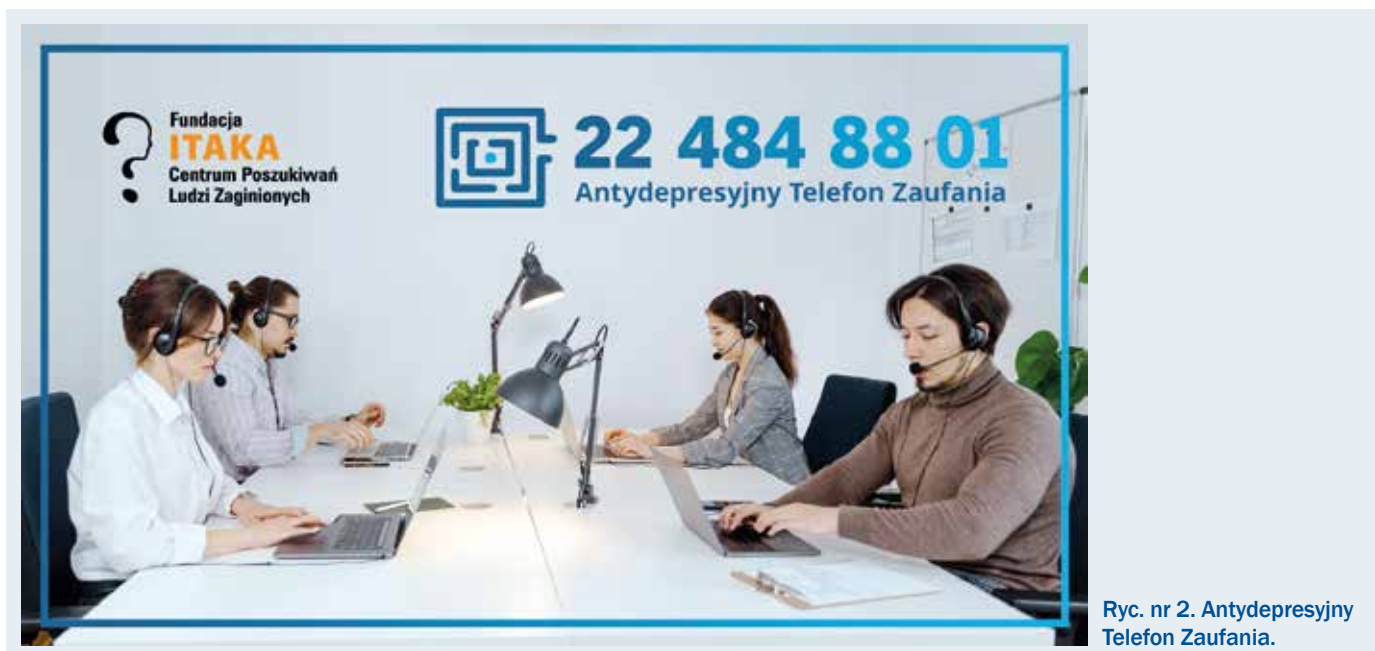
Ryc. nr 2. Antydepresyjny Telefon Zaufania.

Kolejny obszar to kampanie informacyjne dotyczące najczęstszych przyczyn zaginięć danej grupy wiekowej. Co roku realizowane są nowe odsłony kampanii „Opiekuj się dzieckiem”, skierowanej do rodziców małych dzieci. Mówimy o tym, w jaki sposób dbać o bezpieczeństwo dzieci i jak je edukować, aby były bezpieczne. Innym projektem,