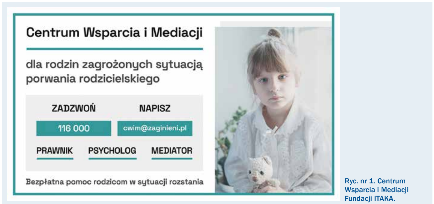
Ryc. nr 1. Centrum Wsparcia i Mediacji Fundacji ITAKA.

ministracji. Ulotkę można pobrać ze strony: https://www.itaka.org.pl/wp-content/uploads/2022/09/10_zasad_bezpiecznego_wyjscia_na_grzybobranie.pdf .