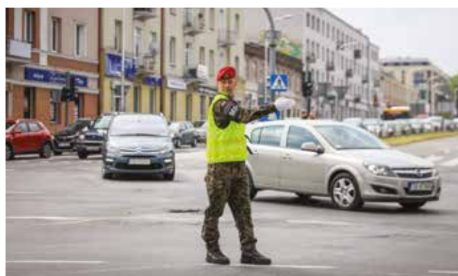
Fot. 11. Konkurencja K-3.