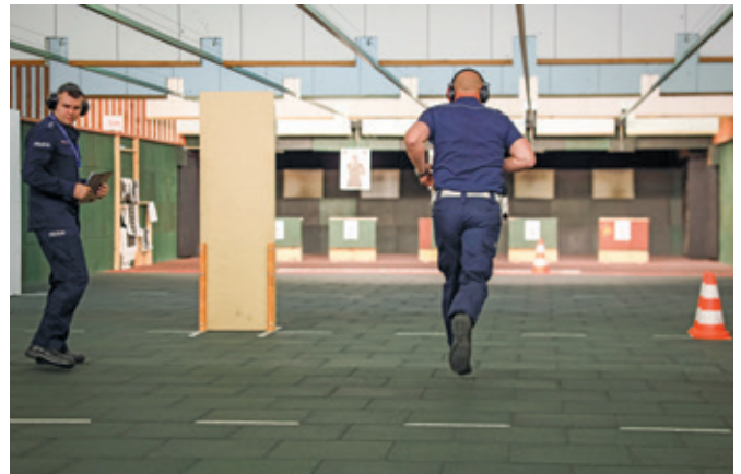
Fot. 7. Konkurencja K-2 – strzelanie z broni służbowej z dobiegiem.

ną w jak najkrótszym czasie, po przebiegnięciu dystansu 100 m (fot. 7–9). Zawodnicy po przygotowaniu się do strzelania stawali na linii startu, gdzie po zgłoszeniu gotowości rozpoczynali bieg na sygnał gwizdka. Po pokonaniu dystansu 100 metrów w drugiej fazie należało oddać 10 celnych strzałów w pozycji stojącej, wymienić magazynek za przesłoną w pozycji kłęczącej, po czym oddać kolejne 10 strzałów w tej pozycji.