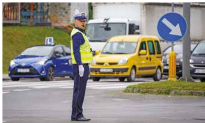
Fot. 10. Jeden z zawodników w trakcie kierowania ruchem drogowym.

Kolejną konkurencją w tym dniu była jazda sprawnościowa motocyklem służbowym (K-4), która polegała na przejechaniu toru w jak najkrótszym czasie (fot. 12). Trudna trasa, również przygotowana przez sędziów z Zakładu Ruchu Drogowego Centrum Szkolenia Policji w Legionowie, wymagała m.in. wykonania slalomu, „ósemki” czy precyzyjnego zatrzymania pojazdu w wyznaczonym miejscu (schemat próby przedstawiono na rys. 2). Każdy z uczestników odbył jazdę próbną, w trakcie której zapoznał się