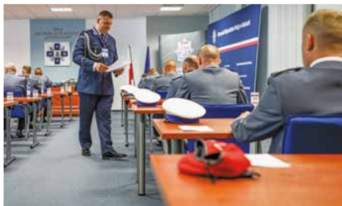
Fot. 13. Rozdanie testów podczas ostatniej konkurencji.