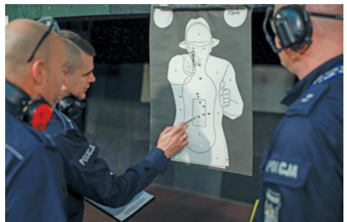
Fot. 9. Sprawdzenie przestrzelen w polu punktowym tarczy jednego z uczestników.