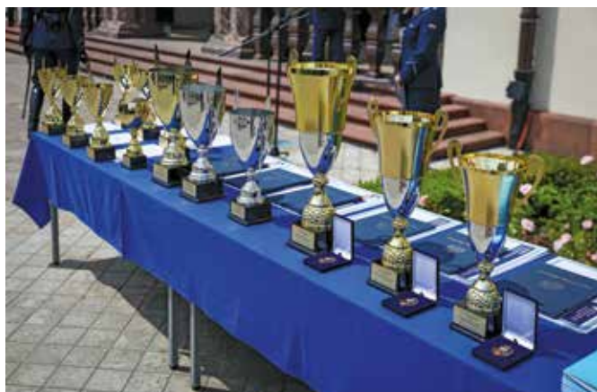
Fot. 15. Pamiątkowe puchary.

Najlepsi policjanci w poszczególnych konkurencjach otrzymali puchary Komendanta Głównego Policji. Pamiątkowe puchary otrzymali także żołnierze Żandarmerii Wojskowej. Trzy drużyny policyjne, które mogły poszczycić się największą liczbą punktów, wraz z trzema najlepszymi policjantami ruchu drogowego poza pu-