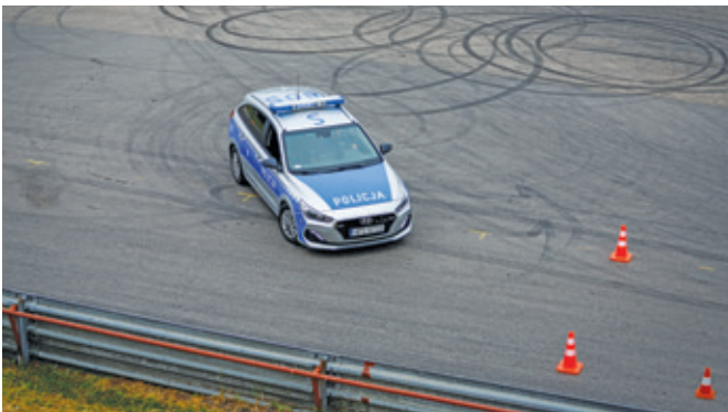
Fot. 5. Przejazd radiowozem na czas po wyznaczonej trasie.