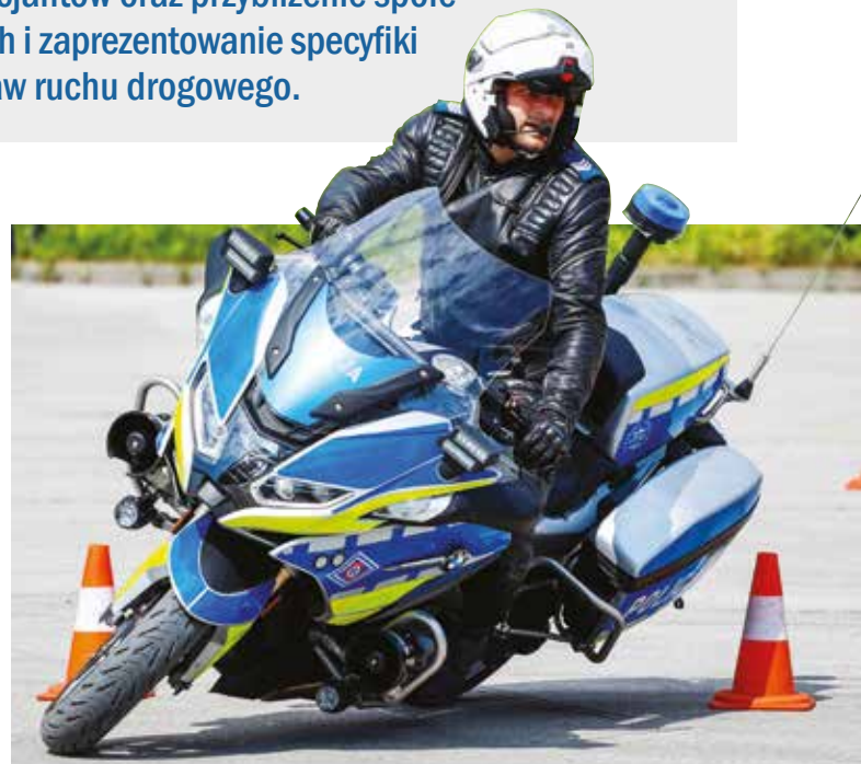
Fot. 1. Jazda sprawnościowa motocyklem służbowym.