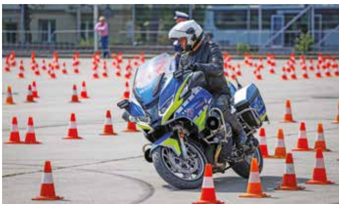
Fot. 12. Jeden z policjantów w trakcie pokonywania trasy.