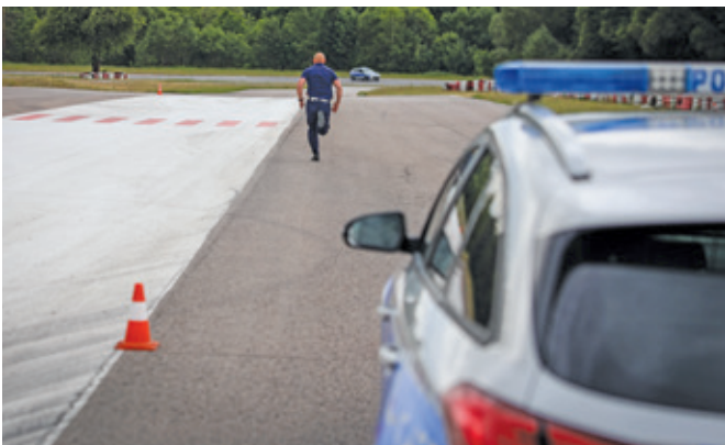
Fot. 6. Bieg jednego z zawodników w czasie próby K-5.