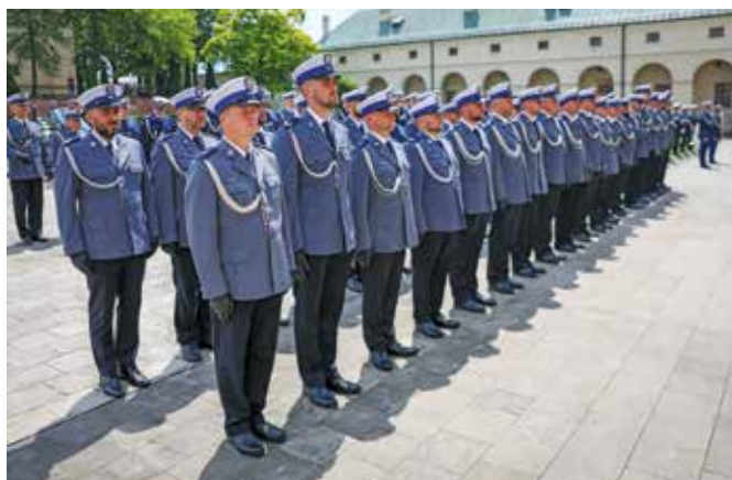
Fot. 16. Ceremonia zakończenia.

charami otrzymali również nagrody pieniężne. Ponadto trzech finalistów z najwyższymi wynikami będzie mogło przystąpić do kursu oficerskiego w Akademii Policji w Szczytnie.