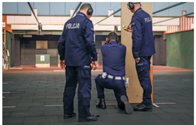
Fot. 8. Strzelanie z broni służbowej w pozycji kłęczącej za przesłoną.