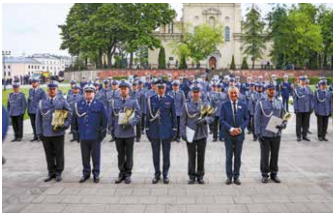
Fot. 17. Wręczenie pucharów Komendanta Głównego Policji dla policjantów w poszczególnych konkurencjach.