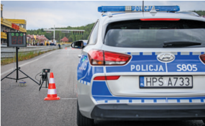
Fot. 4. Konkurencja K-5 – start próby.