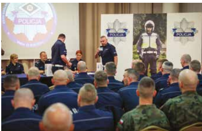
Fot. 2. Losowanie numerów startowych.

W tabeli 1 zaprezentowano funkcjonariuszy, którzy uplasowali się na podium.