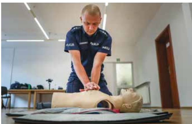
Fot. 3. Jeden z zawodników w czasie sprawdzianu praktycznych umiejętności udzielania pomocy poszkodowanym w wypadkach drogowych.