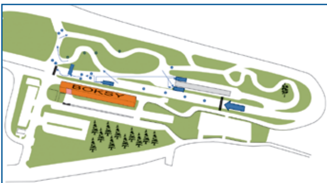
Rys. 1. Schemat trasy samochodowej.