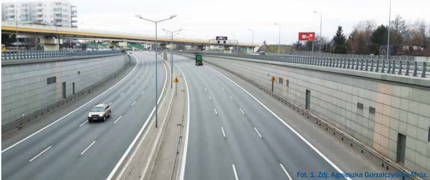
Fot. 1.