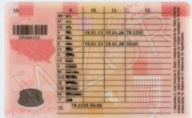
Fot. 2. Awers i rewers prawa jazdy.