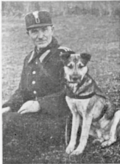
Fot. 2. Przewodnik z psem towarzyszem – Brysiem.