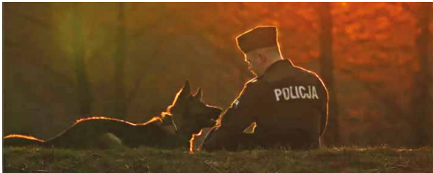
Fot. 4. Współczesny przewodnik z psem służbowym.

Oczywiście nie wszystkie podjęte w ramach tej akcji szkolenia zakończyły się sukcesem i nie każdy pies prywatny stał się pełnoprawnym psem policyjnym.