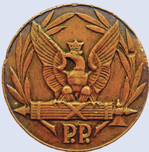
Fot. 5. Awers żetonu wręczanego uczestnikom Ogólnokrajowych Zawodów Sportowych Policji Państwowej (projekt S.R. Koźbiewskiego wykonany z brązu, średnica 34 mm).

W wyniku analizy dokumentów i publikacji prasowych tamtego okresu można zauważyć pewne rozbieżności co do podawanej liczby uczestników pierwszych zawodów policyjnych. Na łamach „Gazety Administracji i Policji Państwowej” opublikowano informację o 132 zawodnikach, natomiast w rozkazie KG PP będącym podsumowa-