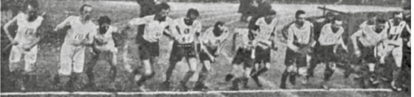
Fot. 1. Start biegu na 3 km. Źródło: Przebieg zawodów sportowych policji , „Gazeta Administracji i Policji Państwowej” 1926, nr 43, s. 693(15), https://jbc.bj.uj.edu.pl/dlibra/publication/242416/edition/230752/content? [dostęp: 24 czerwca 2024 r.].