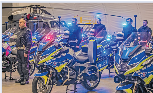
Fot. 1. 24 listopada 2022 r. – przekazanie ostatniej partii zamówienia 478 oznakowanych policyjnych motocykli BMW R 1250 RT, zakupionych w ramach projektu „Bezpieczniej na drogach – motocykle dla służby ruchu drogowego”. Zdj. Jacek Herok, „Gazeta Policyjna”.

Warto wspomnieć o zakupie 478 motocykli BMW R1250 RT. To największy projekt zakupu motocykli w historii Policji. Niezwykle ważny, bo został zrealizowany kompleksowo. Policjanci nie tylko otrzymali jeden z najnowocześniejszych motocykli, ale użytkownicy zostali też przeszkoleni, otrzymali kaski i systemy łączności oraz kombinezony odpowiadające dzisiejszym wymaganiom służby. Widzimy, jak szybko zwiększa się liczba motocykli w ruchu drogowym. Polski policjant pełni służbę bezpiecznie oraz szybko i sprawnie dociera na miejsce zdarzenia, by realizować swoje czynności 13 .