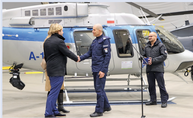
Fot. 2. 12 grudnia 2023 r. – konferencja podsumowująca efekty realizacji projektu – dostawy czterech nowych śmigłowców patrolowo-obszaryjnych Bell-407GX.

w różnych jednostkach i umożliwiają nadzór nad ruchem drogowym w dowolnym miejscu w kraju. Ponadto wszystkie garnizony zostały wyposażone w bezzałogowe statki powietrzne.