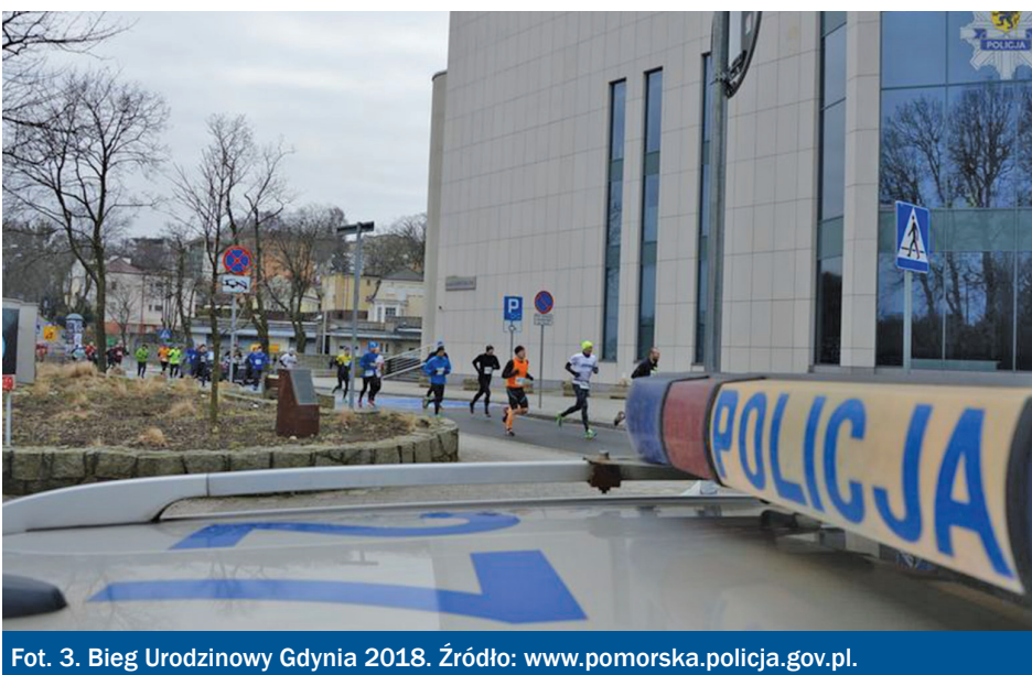
Fot. 3. Bieg Urodzinowy Gdynia 2018.

wodach, czy też osoba, która obserwuje lub przygląda się tym zawodom. Niemniej jednak po analizie przytoczonych określeń „uczestnika” można byłoby wywnioskować, że każda osoba przebywająca na terenie imprezy jest uczestnikiem. W tym miejscu można nadmienić, iż osobę, która znajduje się wśród publiczności zgromadzonej poza miejscami wyznaczonymi przez organizatora, należałoby traktować jako „inną osobę”. Pojęcie takie zostało określone w opracowaniu Jacka Wiercińskiego pt. Rajd samochodowy a przepisy ruchu drogowego – „Paragraf na Drodze” 2008, nr 10, s. 72. Tak więc pojęcie „inne osoby” z reguły oznacza osoby stanowiące publiczność obserwującą rajd. Najczęściej chodzi o osoby znajdujące się w miejscach widowiskowo atrakcyjnych, które też zarazem są miejscami niebezpiecznymi – takimi, które organizator rajdu powinien ze względów bezpieczeństwa skutecznie wyłączyć z obecności osób postronnych. W treści art. 65a ust. 1 p.r.d. ustawodawca zobowiązuje organizatora imprezy do zapewnienia bezpieczeństwa osobom obecnym na imprezie. W związku z powyższym ustawodawca nałożył przytoczony obowiązek na organizatora w celu zapewnienia bezpieczeństwa wszystkim osobom obecnym na imprezie bez znaczenia, w jakim charakterze się znajdują.