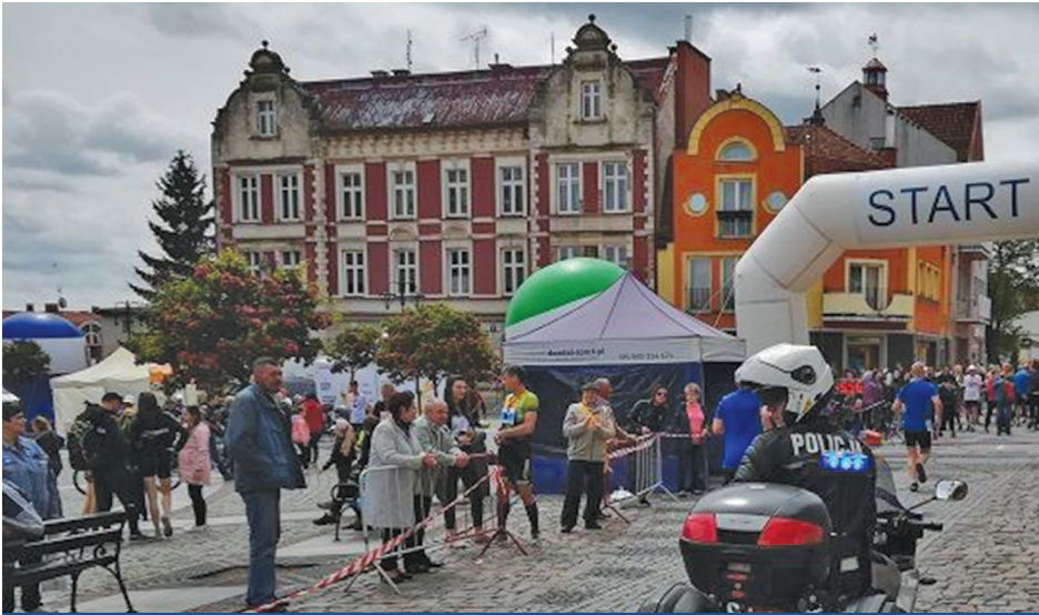
Fot. 1. XXVI Bieg Tura w Człuchowie.