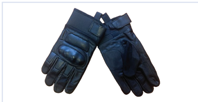
Fot. 10. Rękawice przeciwuderzeniowe.

Rękawice przeciwuderzeniowe opracowano specjalnie do potrzeb i wymagań funkcjonariuszy Policji prowadzących działania interwencyjne, bardzo narażonych na niebezpieczeństwo utraty zdrowia, a nawet życia, pracujących całonocowo w różnych okolicznościach i warunkach pogodowych oraz klimatycznych. Zastosowane technologie umożliwiły osiągnięcie najwyższych poziomów zręczności oraz ochrony przed przecięciem czy podczas palenia. Specjalne, hydrofobowe wykończenie skóry pozwala na zachowanie dobrego chwytu na mokrych przedmiotach i zabezpiecza rękawice przed szybkim nasiąkaniem. Rękawice są symetryczne, wykonane z hydrofobowej, trudnopalnej anilinowej skóry koziej, grubości 0,8–0,9 mm, w kolorze czarnym.