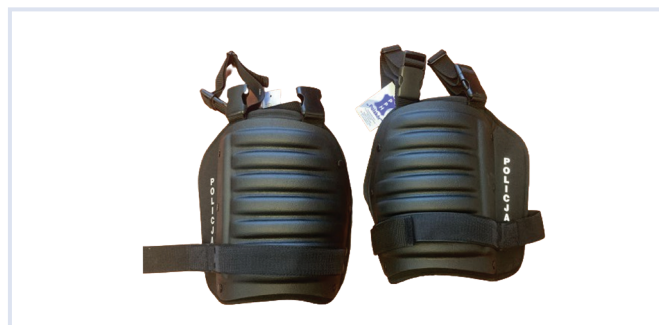
Fot. 8. Ochraniacze ud.