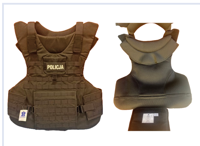
Fot. 2–3. Kamizelka – widok z przodu: strona wierzchnia i strona spodnia.

Wyżej wymienione elementy mają wielowarstwową budowę.