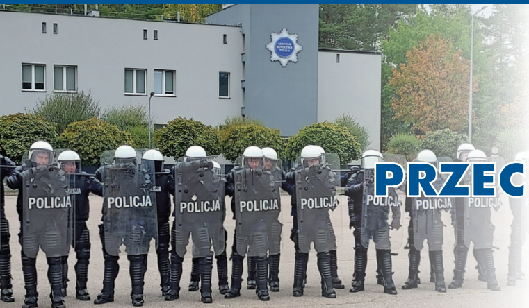
Fot. 1. T. Midro.