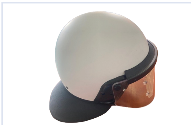
Fot. 11. Kask ochronny z osłoną twarzy.

Kask składa się z czerepu, wkładu amortyzującego, wymiennego wkładu higienicznego, uprząży mocującej, osłony twarzy, osłony karku. Konstrukcja kasku zapewnia możliwość instalacji zestawów łącznościowych stosowanych w oddziałach prewencji Policji (CEOTRONICS). Kask wyposażony jest w zaczepy/gniazda umożliwiające mocowanie maski przeciwgazowej, umieszczone na zewnętrznej stronie czerepu. Osłona twarzy jest wykonana z wysoko wytrzymałego, przezroczystego, odpornego na zarysowania tworzywa, niepowodującego zniekształceń widoczności. Osłona karku zapewnia ochronę karku policjanta przed urazami powstałymi na skutek uderzenia niebezpiecznym narzędziem, np. kijem, pałką drewnianą, kamieniem.