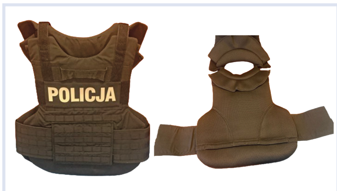
Fot. 4–5. Kamizelka – widok z tyłu: strona wierzchnia i strona spodnia.