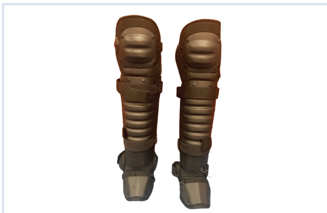
Fot. 9. Ochraniacze nóg.

Zastosowany układ zapięć zapewnia stabilizację ochraniacza na nodze. Lewy ochraniacz nogi jest lustrzanym odbiciem ochraniacza prawego. Na wierzchniej stronie ochraniacza, od strony zewnętrznej goleni, umieszczony jest pionowy odblaskowy napis „POLICJA” w kolorze srebrnym.