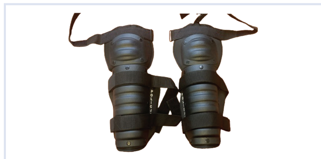
Fot. 7. Ochraniacze przedramion.

Ochraniacze przedramion stanowią ochronę przeciwuderzeniową przedramion – od nadgarstka do łokcia włącznie. Są kompatybilne z ochraniaczami barków i ramion.