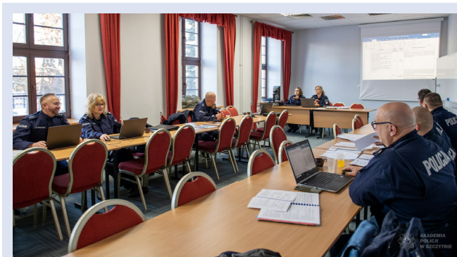
Fot. 2. Prace zespołu ds. zmiany programów w Akademii Policji w Szczytnie.