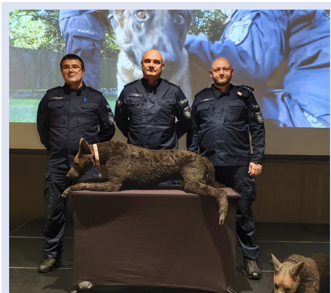
Fot. 1. Instruktorzy Zakładu Kynologii Policyjnej Centrum Szkolenia Policji w Legionowie podczas szkolenia dla przewodników psów służbowych realizowanego w ramach projektu TROPIK-9.