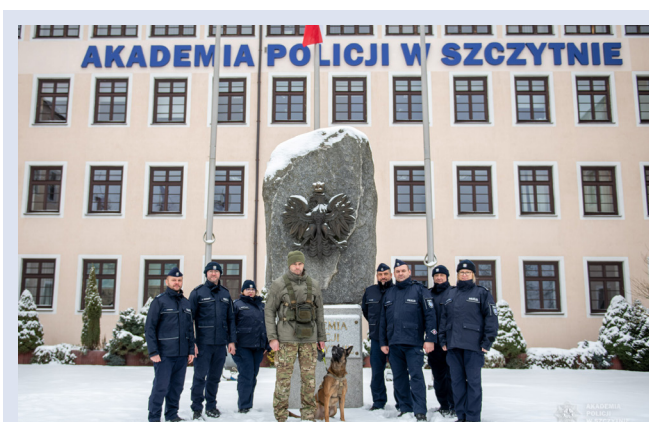
Fot. 3. Członkowie zespołu z psem służbowym „Ryjkiem”.